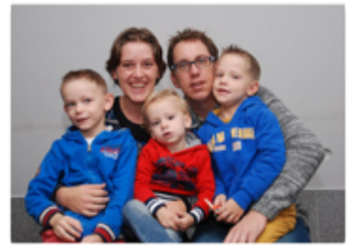
DOOP VAN TWEE NIEUWE GELOVIGEN EIND MAART