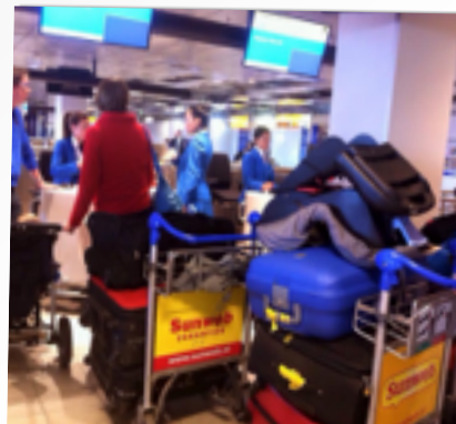
DAAR GAAN WE WEER...