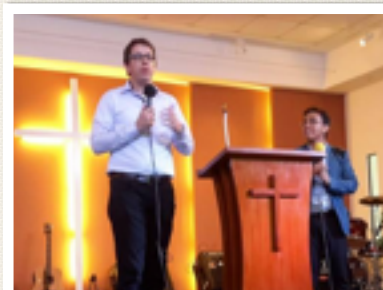
PREKEN IN BANGKOK