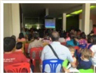
PAASVIERING IN KHON KAEN